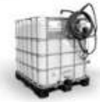
Uw AdBlue leverancier